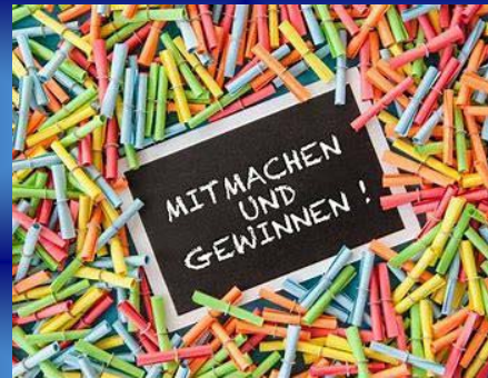
Tombola mit großartigen Gewinnen