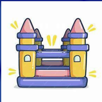
Hüpfburg vor Ort