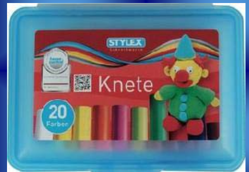
Stylex 20er Schulbox für nur 3,99€