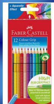
Faber-Castell Grip Farbstifte für nur 8,99€