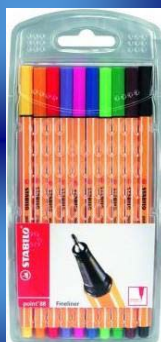
Stabilo point88 10er Etui für nur 8,99€