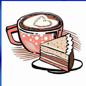
Kaffee, Kuchen und Getränke